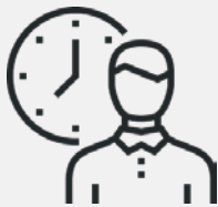
Flexible Arbeitszeiten & -gestaltung