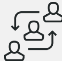
Förderung durch Feedback