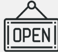
Open-Door-Policy: Erfahrungsaustausch mit Kollegen und Vorgesetzten