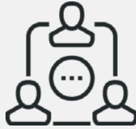
Flache Hierarchien und kurze Kommunikationswege